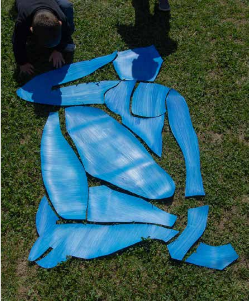
Comme Matisse